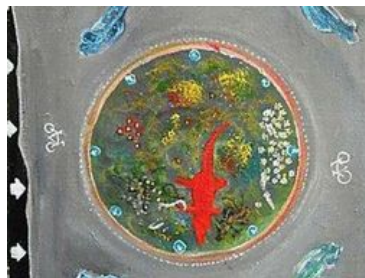
Il cocodrillo di Mitrovich